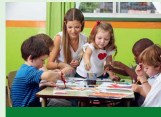
Spielerische Schulung für Kinder