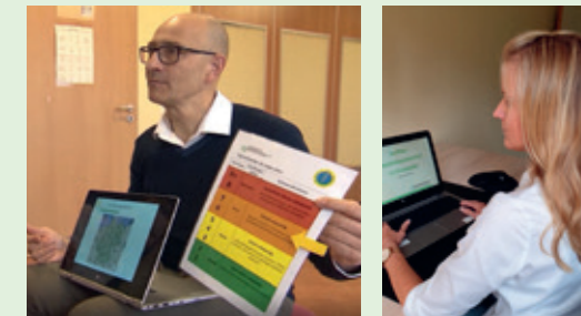
Schulung der Erzieher in Präsenz oder Online